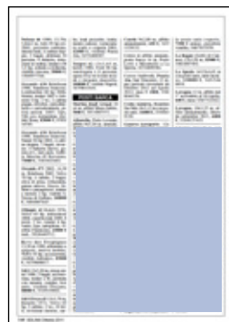
sei moduli orizzontali dimensioni: 98x120 mm 360 euro