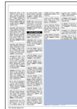
quattro moduli verticali dimensioni: 64x120 mm 240 euro