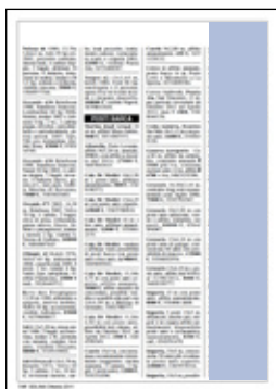
tre moduli verticali dimensioni: 30x188,5 mm 180 euro