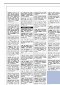
mezzo modulo dimensioni: 30x27,75 mm 25 euro