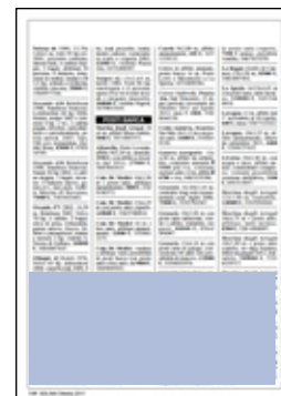
quattro moduli orizzontali dimensioni: 132x60 mm 240 euro