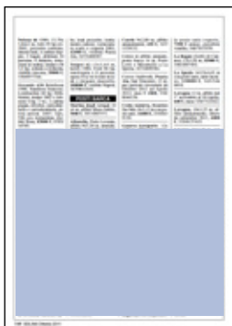
otto moduli dimensioni: 132x120 mm 480 euro