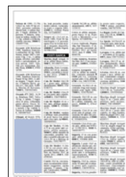
un modulo dimensioni: 30x58,5 mm 50 euro