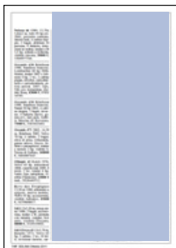
nove moduli dimensioni: 98x188,5 mm 540 euro

La sezione delle Inserzioni Gratuite (riservate ai privati), pubblicata da pagina 101* di BOLINA in poi, sono un autentico "mercato" nautico dell'uso; qui avvengono scambi di attrezzature, si cerca o si vende un'imbarcazione, accessori, imbarchi, lavoro e si trova l'indirizzo "giusto" per vivere meglio il tempo libero in barca. La regolare cadenza nell'uscita nelle edicole e la spedizione agli abbonati con sistema "differenziato" assicura alla pubblicazione una puntualità rara nel panorama editoriale italiano. È questa una sezione di grande consultazione con spazi pubblicitari a prezzi promozionali, riservati ad agenzie di noleggio, scuole di vela e aziende del settore.