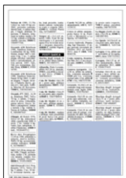
tre moduli orizzontali dimensioni: 98x58,5 mm 180 euro