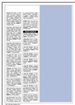
sei moduli verticali dimensioni: 64x188,5 mm 360 euro